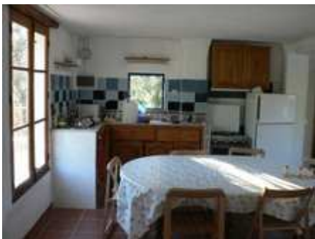
Salle de séjour et cuisine